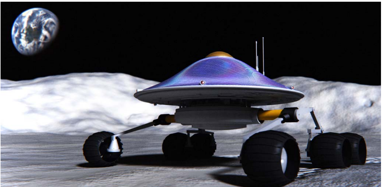
Fig.02 - El Módulo Rover en la superficie de la Luna

El subsistema de la energía es responsable de la generación de energía, almacenamiento, gestión y distribución. El diseño de referencia consiste en una combinación de paneles solares y las baterías como la combinación más sencilla y eficaz. El rover tiene tres modos de funcionamiento diferentes: pico, nominal y el modo en espera. También se prevé que para los distintos modos, algunos componentes no serán operativo al mismo tiempo.